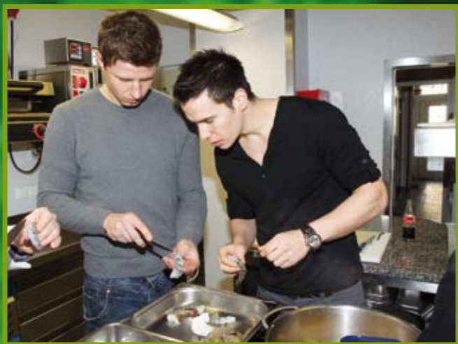
Ist der Darm auch wirklich entfernt? Kontrolle muss sein...