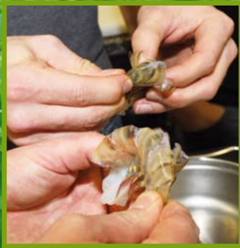
Die Därme müssen sorgsam entfernt werden. Handarbeit war gefragt.