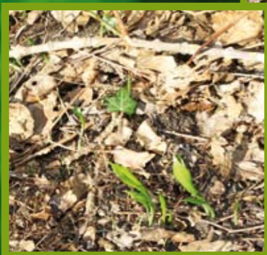
So sieht er aus der Bärlauch. Sein Geruch allein ist schon unverwechselbar, erinnert etwas an Knoblauch und lässt schon beim Pflücken den Appetit wachsen.