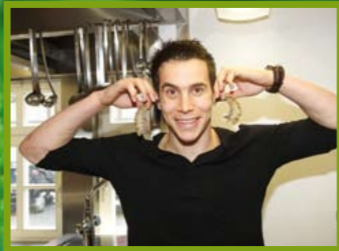
Mit der leeren Hülle der Gambas lässt sich noch so einiges anfangen....