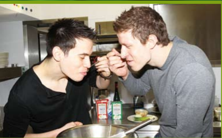
Kein kochen ohne naschen. Die TBV-Profis ließen es sich ebenfalls nicht nehmen, vorab zu probieren.